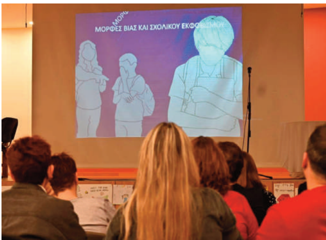
ΕΝΗΜΕΡΩΤΙΚΗ ΕΚΔΗΛΩΣΗ ΣΤΟΝ ΔΗΜΟ ΑΧΑΡΝΩΝ

ΕΤΟΣ 23 ο • ΦΥΛΛΟ 5448 • Μ. ΤΡΙΤΗ 15 ΑΠΡΙΛΙΟΥ 2025 • ΗΜΕΡΗΣΙΑ ΕΦΗΜΕΡΙΔΑ • ΤΙΜΗ ΦΥΛΛΟΥ: 0,20€