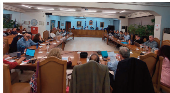
ΔΕΣΜΕΥΣΗ ΤΟΥ ΔΗΜΑΡΧΟΥ ΑΓΙΟΥ ΔΗΜΗΤΡΙΟΥ

Αλλαγή σελίδας στη διαχείριση των ζώων συντροφιάς